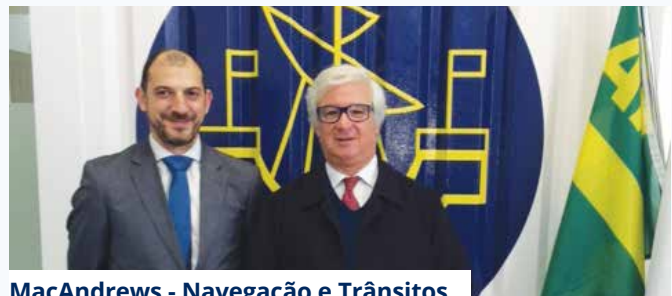
MacAndrews - Navegação e Trânsitos