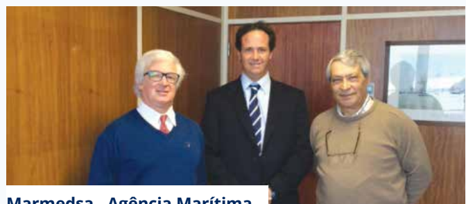
Marmedsa - Agência Marítima