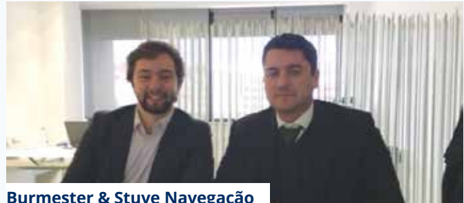
Burmester & Stuve Navegação