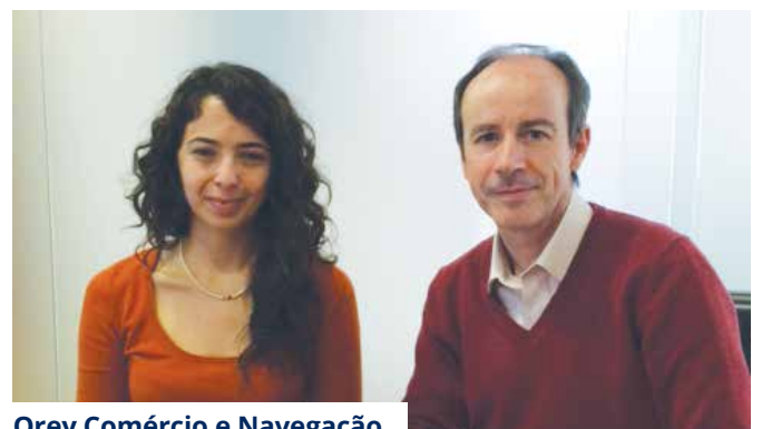
Orey Comércio e Navegação