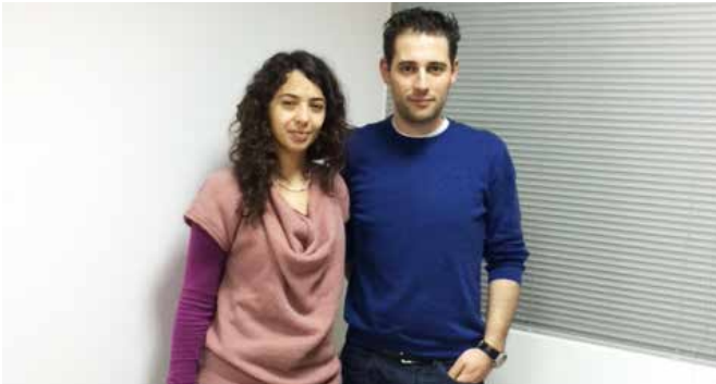
Alpi Portugal - Navegação e Trânsitos