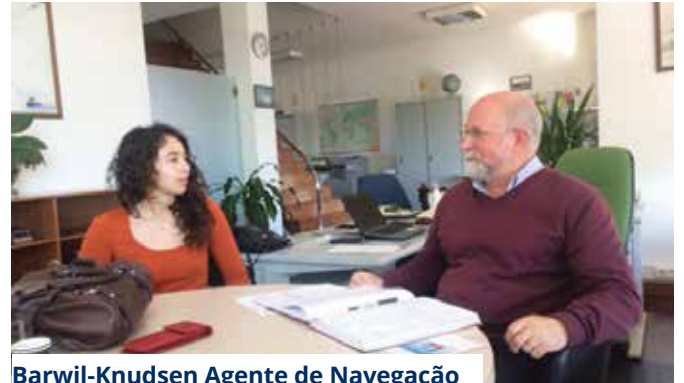
Barwil-Knudsen Agente de Navegação