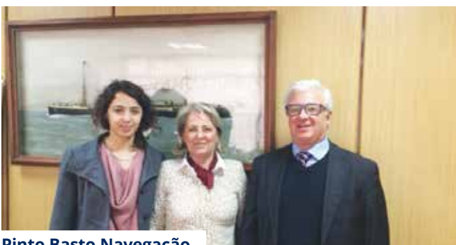
Pinto Basto Navegação