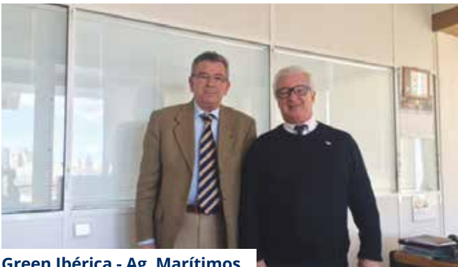
Green Ibérica - Ag. Marítimos