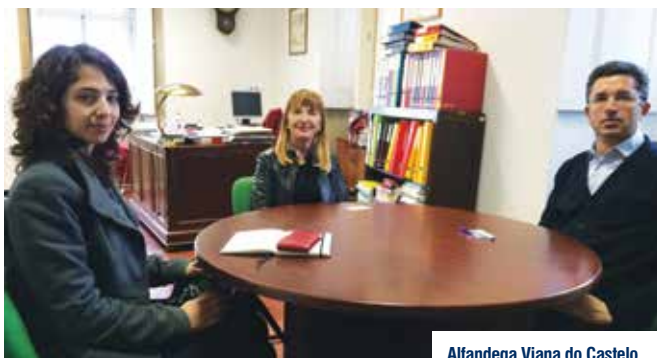
Alfandega Viana do Castelo