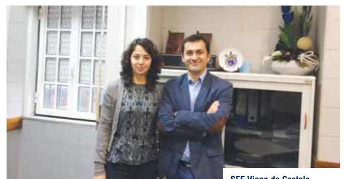
SEF Viana do Castelo