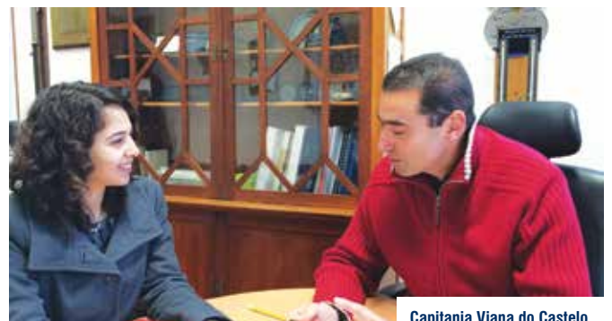
Capitania Viana do Castelo